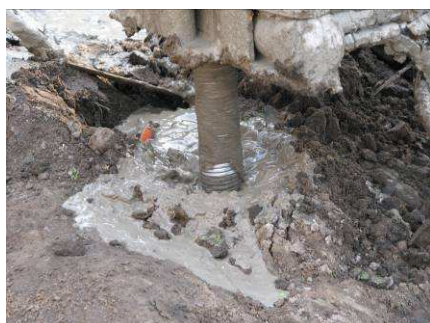
PŁUCZKA CEMENTOWA WYNOŚZĄCA UROBEK PODCZAS WIERCENIA

Roboty palowe miały na celu wzmocnienie posadowienia projektowanych fundamentów pawilonu na Rynku Starego Miasta w Sieradzu.