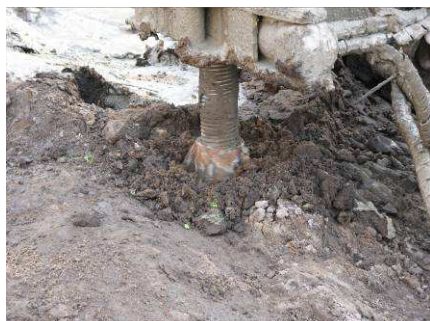
POCZĄTEK WIERCENIA MIKROPALI

Roboty palowe miały na celu wzmocnienie posadowienia projektowanych fundamentów pawilonu na Rynku Starego Miasta w Sieradzu.