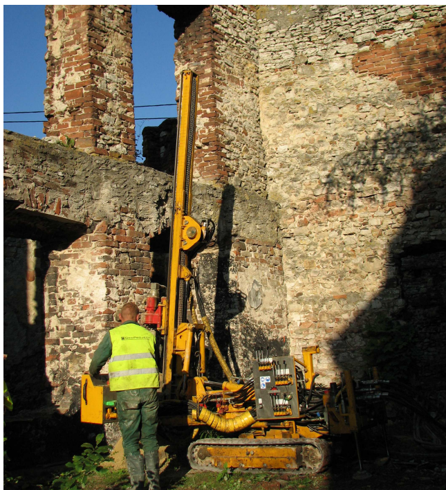
WIERCENIE MIKROPALI INIEKCYJNYCH

Mikropale, wzmacniające posadowienie istniejących fundamentów Zamku rewitalizowanego na obiekt hotelowo – rekreacyjny, pozwoliły na ograniczenie ich przemieszczeń, a tłoczony zaczyn iniekcyjny wypełnił istniejące kawerny w podłożu.