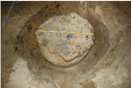
PRÓBNA KOLUMNA „JET GROUTING” ŚREDNICY 1000mm