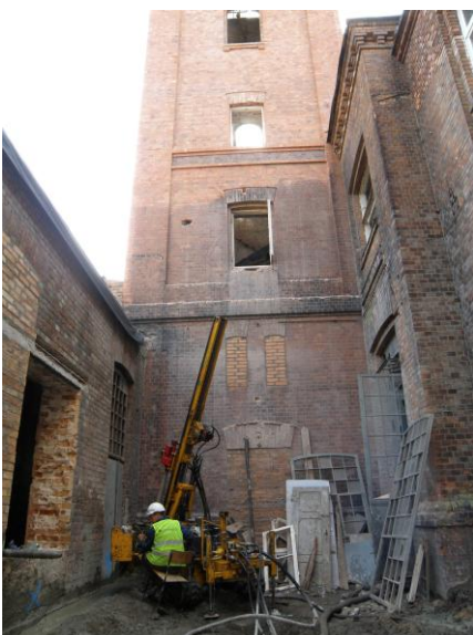
WYKONYWANIE KOLUMN „JET GROUTING” PRZY WIEŻY