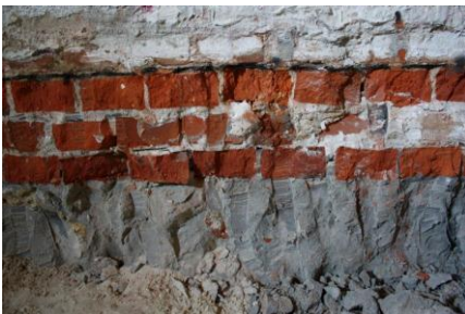
PRZEGLĘBIONE FUNDAMENTY KOLUMNAMI „JET GROUTING”